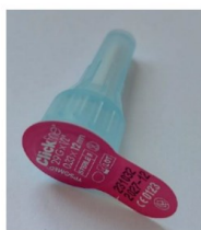
Opercule violet (Ypsomed) : aiguille à clipser

Actuellement les deux types d'aiguille cohabitent sur le marché. Par conséquent, nous vous recommandons de lire attentivement la notice d'utilisation dans laquelle vous trouverez les caractéristiques du stylo et la manipulation correcte à effectuer. L'opercule du conditionnement de l'aiguille vous permettra de différencier facilement l'une de l'autre :