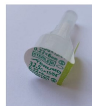
Opercule blanc et vert (Terumo) : aiguille à visser